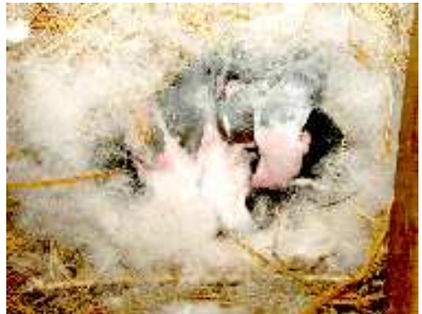
Nid de lapereaux.

Malgré les erreurs, les accouplements orchestrés réussissaient. Sur 12 femelles croisées, on obtenait 9 mises bas. Une lapine pouvait avoir en moyenne 6 lapereaux.