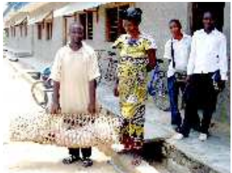
Transport de porc.

Au premier tour, deux géniteurs femelles de porcs ont été octroyés dans chaque ménage et au total nous avons ciblé 16 ménages. Concernant les lapins, chaque ménage bénéficie de deux géniteurs femelles et un mâle. La seule condition d'acquisition est d'avoir construit une porcherie en matériel local (bambous, planche de parasolier, etc.) pour le porc et un clapier pour les lapins. Les bénéficiaires s'engagent à nourrir, sécuriser et soigner les bêtes qui leur appartiennent déjà. Cependant, tout le monde veut bénéficier de cette grâce. Vu les moyens disponibles et le nombre des ménages dans ce village, nous avons décidé qu'à la première reproduction, les